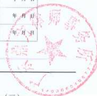
律师事务所变更登记（二）