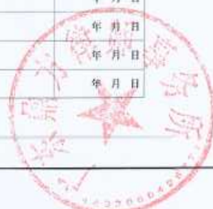
律师事务所变更登记（六）